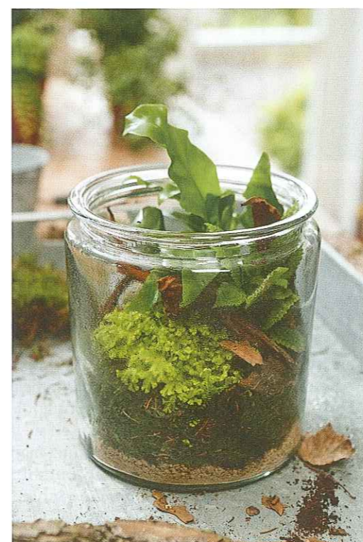
Nestfarn, Selaginella und Rindenstücke im Moos bilden eine kleine Waldlandschaft. In offenen Gefäßen sollten Pflanzen häufiger befeuchtet werden.

Es ist spannend, einmal im Atlas nachzuschlagen, in welchen Teilen der Erde unsere Zimmerpflanzen beheimatet sind.